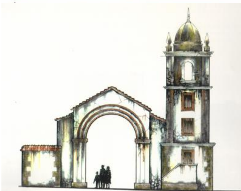
Ilustração 2 – Esboços para o Galaxy Park - intenções